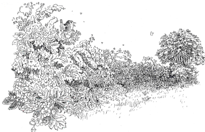
Fig. 61: Een karakteristieke Zeeuwse, uitgedijde, gemengde heg

Ieder winterhalfjaar werden eventuele gaten in de heggen dicht gevlochten. Brandhout was een gewaardeerd bijproduct van de heggen. Fijne doorntakken gaven de felste hitte in de bakoven. De doorntakken werden op hopen bewaard. Beschutting voor vee en gewas was bijkomend voordeel. De lange takdorens van sleedoorn werden als worstpinnen gebruikt. Jonge rozen werden uitgestoken en als onderstammem verkocht aan kwekerijen. Rozenbottels werden geplukt en verkocht.