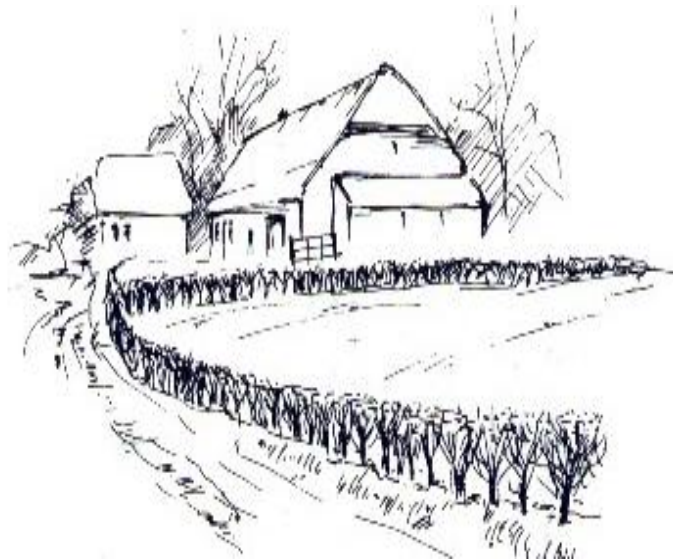
Fig. 60: heg als afscheiding

Heggen werden vooral aangeplant als veekering, en bestonden daarom bijna altijd uit doornige gewassen. De struik die het meest in de heg voorkomt is de meidoorn. Andere doornstruiken die in de meidoornheg voorkomen zijn hondsroos, sleedoorn en (koe)braam. Verder groeiden er ook vaak vlier, es, iep, spaanse aak of veldesdoorn en liguster in. Deze gemengde heggen zijn typisch Zeeuws en worden daarom ook Zeeuwse hagen genoemd. Heggen van haagbeuk en beuk kwamen vroeger niet zo veel voor in Zeeland. Op de Zeeuwsvlaamse zandgronden zijn nog wel eens heggen van hulst te zien.